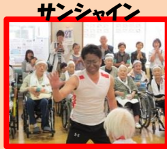
サンシャイン 応援合戦(紅組) め組のひと