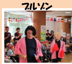
フリン 応援合戦(白組) 365歩のマーチ