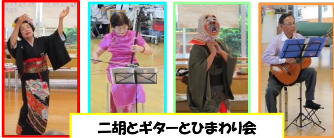
二胡とギターとひまわり会