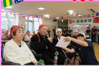
団長による選手宣誓