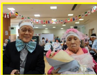
☆ご夫婦でパチリッ☆