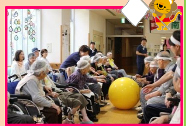
☆最終競技大玉ころがし☆