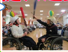
毎年恒例の関ヶ原の戦い