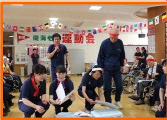
☆職員による障害物競争☆