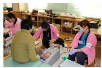
フットケア・骨密度測定