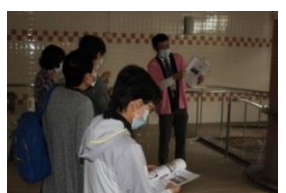
老健見学ツアーも行いました！！