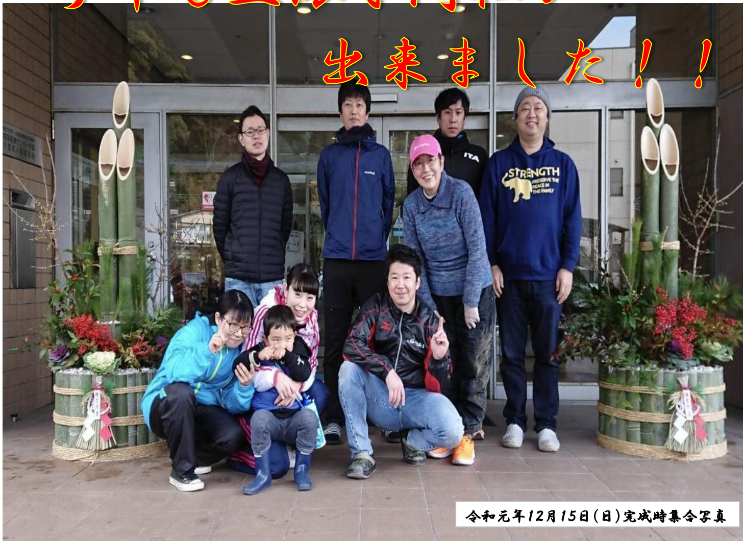
令和元年12月15日(日)完成時集合写真

年末より当施設の玄関に立派な門松が登場しました。毎年職員有志が、竹伐りから組み立てまで行なっております。来所される方々に、年末年始の雰囲気を感じていただければと思い数年前より始め、今年は、新病院玄関の門松作りの依頼もあり作製しました。今シーズンは、雪が舞う日も未だ無く、日中気温も上がり、昨年より、暖冬ではないかと思う日が多々ありました。立春も過ぎ暦の上では、春となりましたが、まだまだ冷え込むこともありますので、お身体に十分お気を付け下さい。本年も入所者様・デイ利用者様・ご家族の皆様楽しんでいただけるよう、職員一同一丸となって、より良いサービスの提供に努めてまいりますので、よろしくお願いたします。