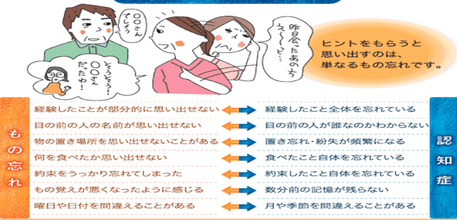
もの忘れと認知症の違い

今回は、「物忘れ(健忘)」と「認知症」の違いについてです。「物忘れ」とは出来事の一部を忘れてしまうことで、食事を食べたことは覚えているが「何を食べたか思い出せない」という状態。「認知症による物忘れ」は出来事そのものを忘れるため「食事をしたこと自体」を忘れてしまい「ごはんはまだ？」と何度も催促するような事があります。当施設では、認知症の予防・改善のため計算や書字パズル等の脳トレ、手工芸や生花、物品整理等の作業活動など様々な取り組みを行なっています。利用者様一人一人が楽しく笑顔で出来るように配慮を行ないながら、今後もリハビリを提供させて頂きます。