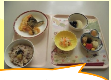
9/20敬老の日の昼食です！！