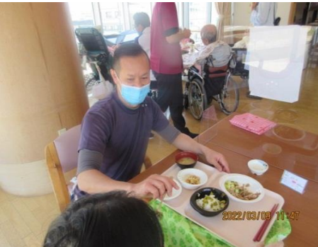
お食事美味しいでしょう