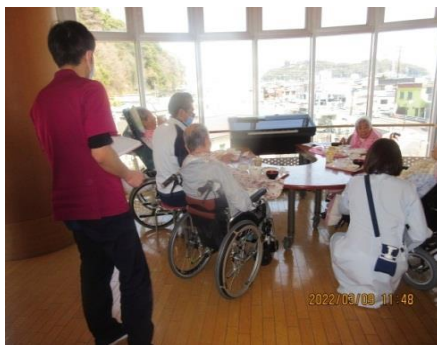
食事摂取状態の確認中です。多職種で連携しています。