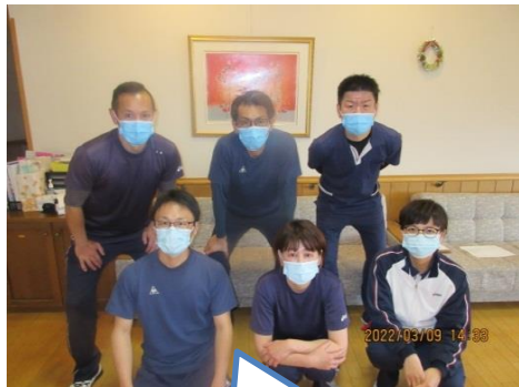
3階本日の介護集合写真です！

介護技術を高めるとともに、ご利用者様の身の周りの環境を整えたりと工夫をこらし、ご利用者様がここに望む生活スタイルで過ごせるよう、ケアを他職種チームで話し合い、ご利用者様の残存機能力を活かし、引き出せるケアを目指しています。