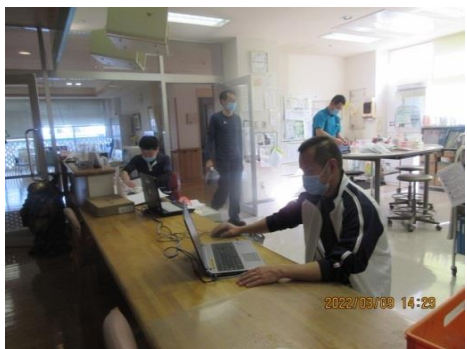
日々の記録をしています！