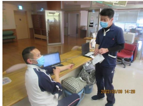
日々情報共有しています！