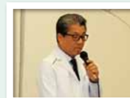
平成30年4月2日 新入職員対面式の模様

Q1 地域の皆様へむけて 初めて佐伯での勤務です。 皆様よろしくお願いいたします。