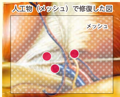
● ヘルニアの原因となる穴

前回は鼠径ヘルニアについてご説明しました。鼠径ヘルニアとは、お腹の壁が脆くなり、そこからお腹の中の臓器が飛び出す状態ですから、治療は手術でその穴を塞げばいいんです。