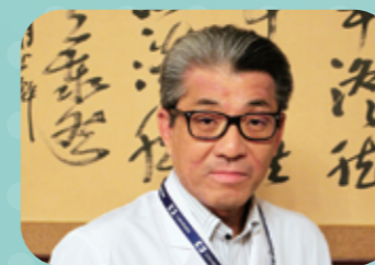
南海医療センター院長 兼 附属介護老人保健施設長