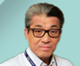
南海医療センター院長 兼 附属介護老人保健施設長

職員一同気持ちを新たに、地域医療を支え信頼される医療を提供する所存でありますので今後ともよろしくお願いいたします。