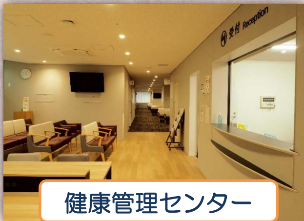
健康管理センター