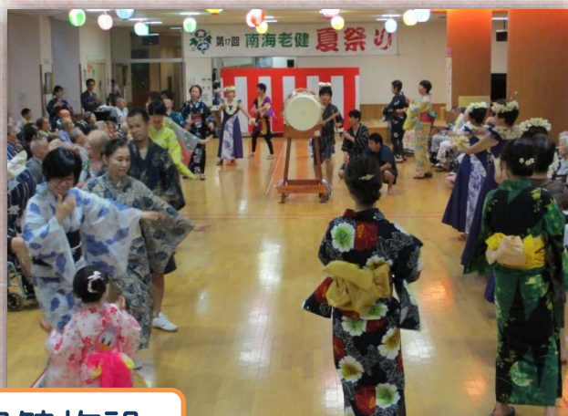
附属介護老人保健施設