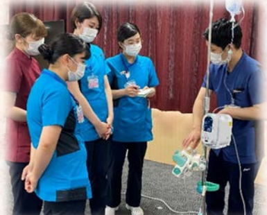
輸液ポンプの取り扱い