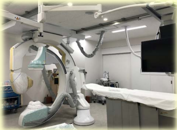
県南唯一の 心臓カテーテル治療施設