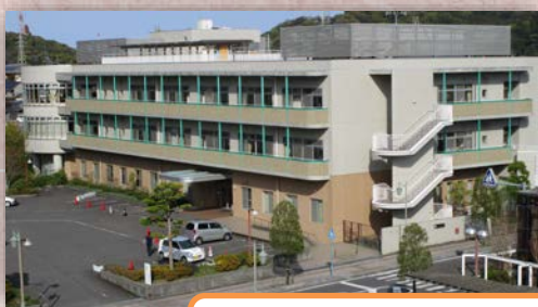
附属介護老人保健施設