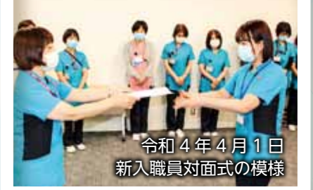
令和4年4月1日 新入職員対面式の模様