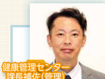
健康管理センター 課長補佐(管理)