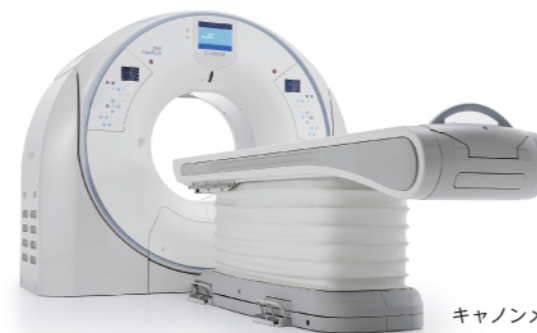
キャノンメディカルシステムズ社製 320列CT Aquilion ONE