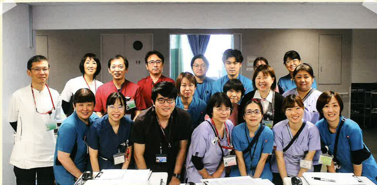
筆者：前列左から3番目