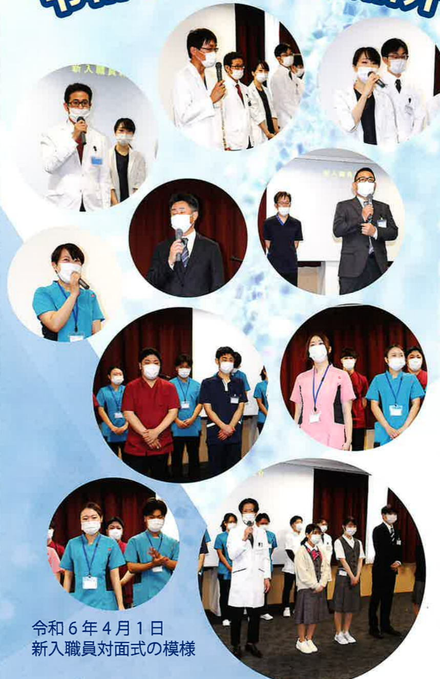
令和6年4月1日 新入職員対面式の模様